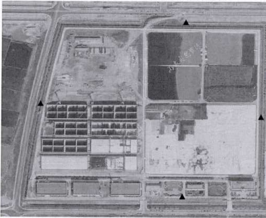
噪声检测点位示意图